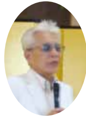
介護老人保健施設 福島施設長