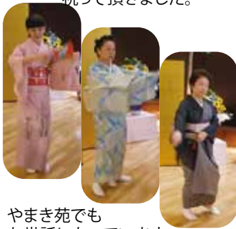
やまき苑でも お世話になっています。