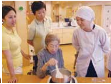
利用者の方が協力してくだ さり、どんどんおやつが出来 てきました。