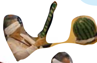
スイカ割りゲームをしました♪