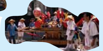
ありがとうございました