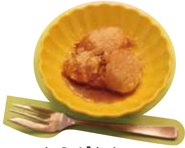
わらびもち 出来上がり