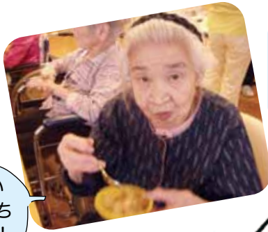
おいしい わらびもち 大成功!!