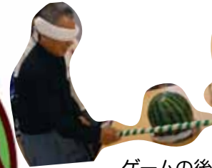
ゲームの後はみんなで美味しく頂きました。