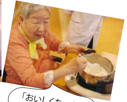
「おいしくな〜れ」と おまじない♡♡♡