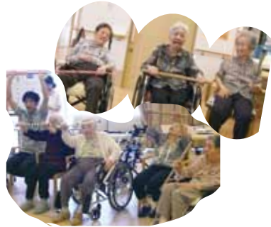
毎週棒体操は元気いっぱい!