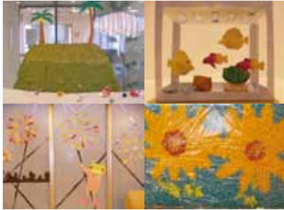
↑『老健8月の作品コーナー』