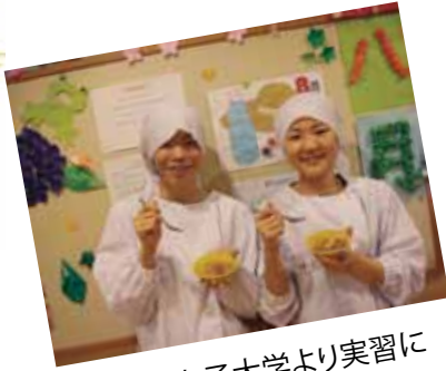
武庫川女子大学より実習に 来ました。皆さんと一緒に おやつを作ります♪