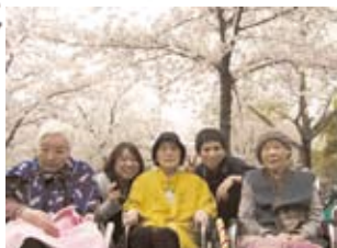
日中、天下茶屋公園へ行ってき ました。ちょうど満開で利用者の 方々喜ばれておられました。