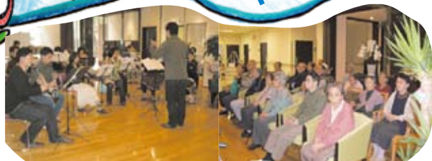
4月1日(日)吹奏楽演奏会を行いました。生演奏で みなさん癒されておられました。

5月の スケジュール 13日母の日イベント 18日おやつレク 20日誕生日会 毎週土曜日 映画上映会